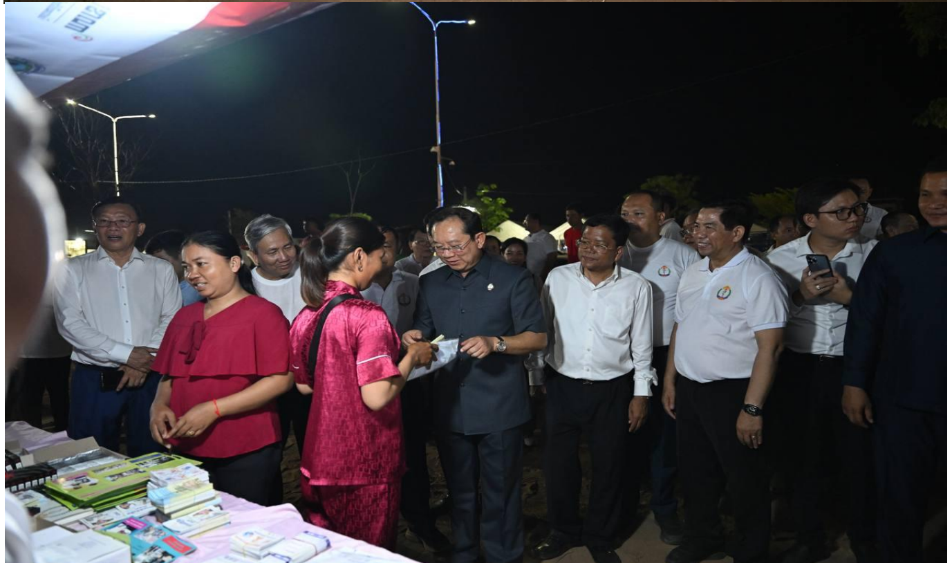
សកម្មភាពអប់រំផ្សព្វផ្សាយ និងធ្វើតេស្តរកមេរោគអេដស៍ និងមេរោគស្វាយ ក្នុងព្រឹត្តិការណ៍នៃព្រះរាជពិធីបុណ្យអុំទូក បណ្តែតប្រទីប និងសំពះព្រះខែ អកអំបុក