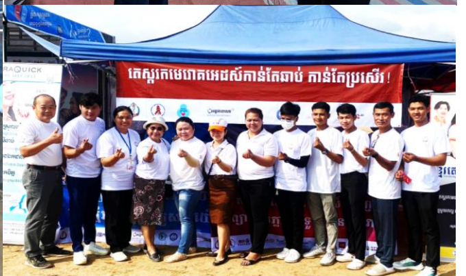
សកម្មភាពអប់រំផ្សព្វផ្សាយ និងធ្វើតេស្តរកមេរោគអេដស៍ និងមេរោគស្លាយ ក្នុងព្រឹត្តិការណ៍នៃព្រះរាជពិធីបុណ្យអុំទូក បណ្តែតប្រឡឹម និងសំពះព្រះខែ អកអំបុក