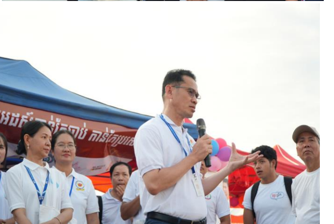
សកម្មភាពអប់រំផ្សព្វផ្សាយ និងធ្វើតេស្តរកមេរោគអេដស៍ និងមេរោគស្លាយ ក្នុងព្រឹត្តិការណ៍នៃព្រះរាជពិធីបុណ្យអុំទូក បណ្តែតប្រឡូង និងសំពះព្រះខែ អកអំបុក