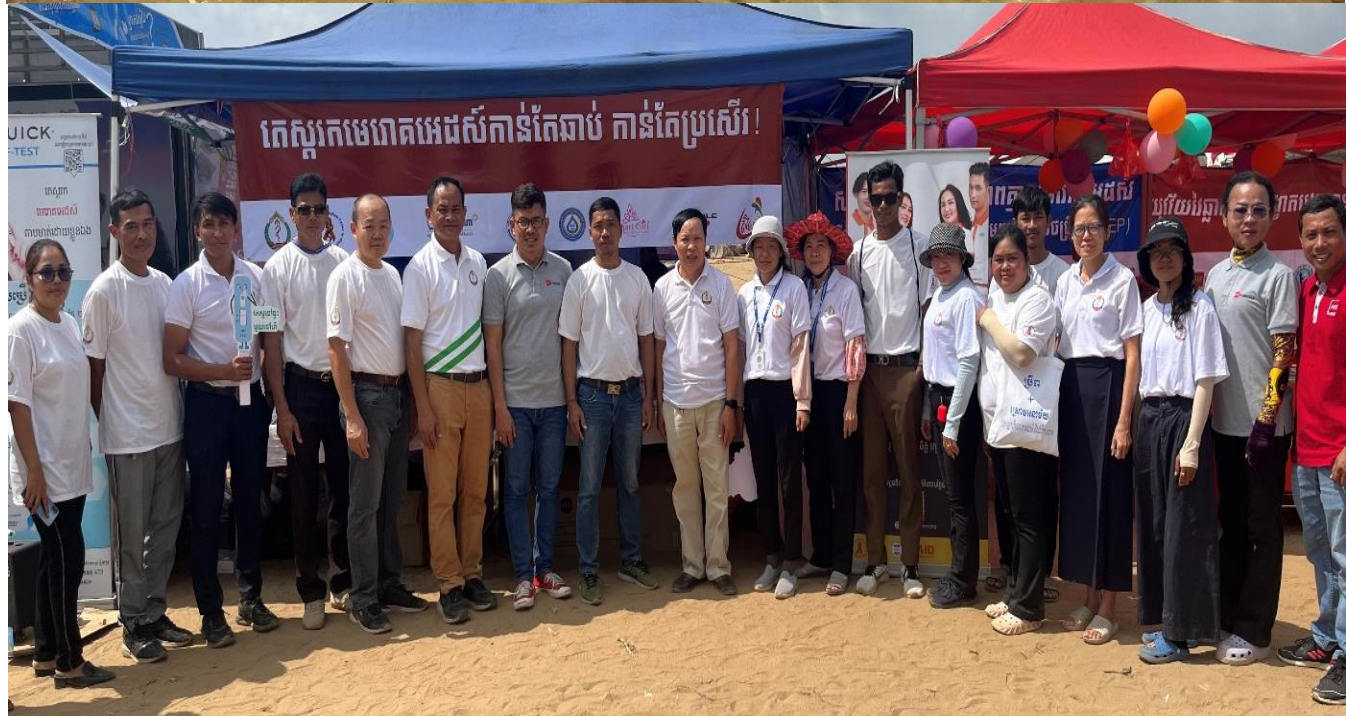
សកម្មភាពអប់រំផ្សព្វផ្សាយ និងធ្វើតេស្តរកមេរោគអេដស៍ និងមេរោគស្វាយ ក្នុងព្រឹត្តិការណ៍នៃព្រះរាជពិធីបុណ្យអុំទូក បណ្តែតប្រទីប និងសំពះព្រះខែ អកអំបុក