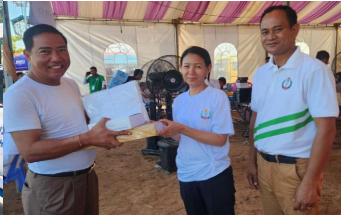
សកម្មភាពអប់រំផ្សព្វផ្សាយ និងធ្វើតេស្តរកមេរោគអេដស៍ និងមេរោគស្លា ក្នុងព្រឹត្តិការណ៍នៃព្រះរាជពិធីបុណ្យអុំទូក បណ្តែតប្រឡូង និងសំពះព្រះខែ អកអំបុក