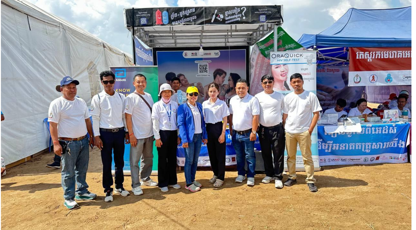
សកម្មភាពអប់រំផ្សព្វផ្សាយ និងធ្វើតេស្តរកមេរោគអេដស៍ និងមេរោគស្វាយ ក្នុងព្រឹត្តិការណ៍នៃព្រះរាជពិធីបុណ្យអុំទូក បណ្តែតប្រឡូង និងសំពះព្រះខែ អកអំបុក